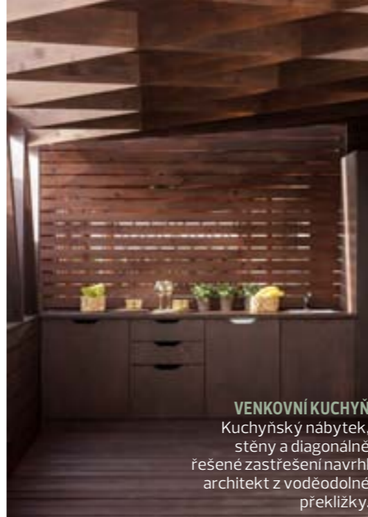
VENKOVNÍ KUCHYŇ Kuchyňský nábytek, stěny a diagonálně řešené zastřešení navrhl architekt z voděodolné překližky.

ve Philadelphii, když měli volno, cestovali. Největší inspirací použitou ve vlastním bytě jsou vzpomínky na oblíbená místa a lidi, hlavně na opakované návštěvy Bali. „Máme to tam strašně rádi. Žádný luxus, ale funkční jednoduchost, která dělá život šťastnější,“ k čemuž dodávají: „Člověk se tu zpomalí, vnímá jen ‚tady a teď‘. Nemá potřebu nic řešit a komplikovat. Byt je naší společnou Asii.“ Proto jsou v koupelně dřevěné prvky,